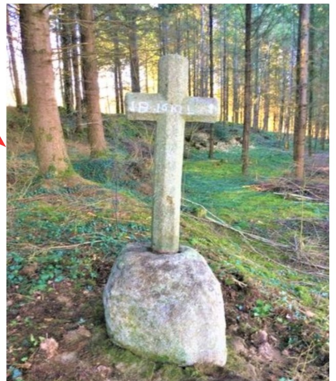
Croix du Méry à La Saunière Cette croix est connue sous le nom de «croix des morts». Elle est située au milieu d'une sapinière. C'est un croix latine chanfreinée, reçue par un socle qui est un gros bloc de granit sur lequel on retrouve quatre entailles d'éclatement. Cette croix assez classique est très ancienne comme en atteste la date gravée au centre du croisillon et une partie des initiales illisible : J B 1610 L.