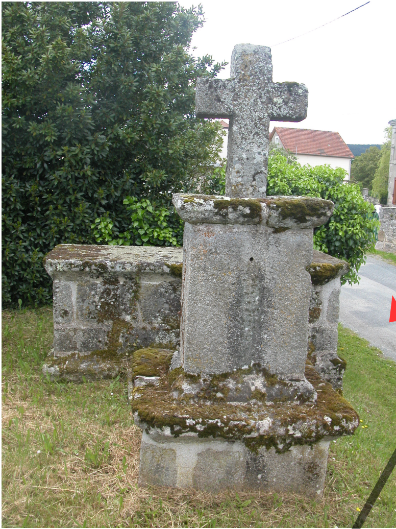
Croix reposoir du Bois Valette Cette croix est imposante du à la présence d'un "autel". Il n'y a pas de précisions sur cet ouvrage. L'inscription est peu lisible, mais permet de la dater du 18e siècle. Le tout a été rénové récemment.