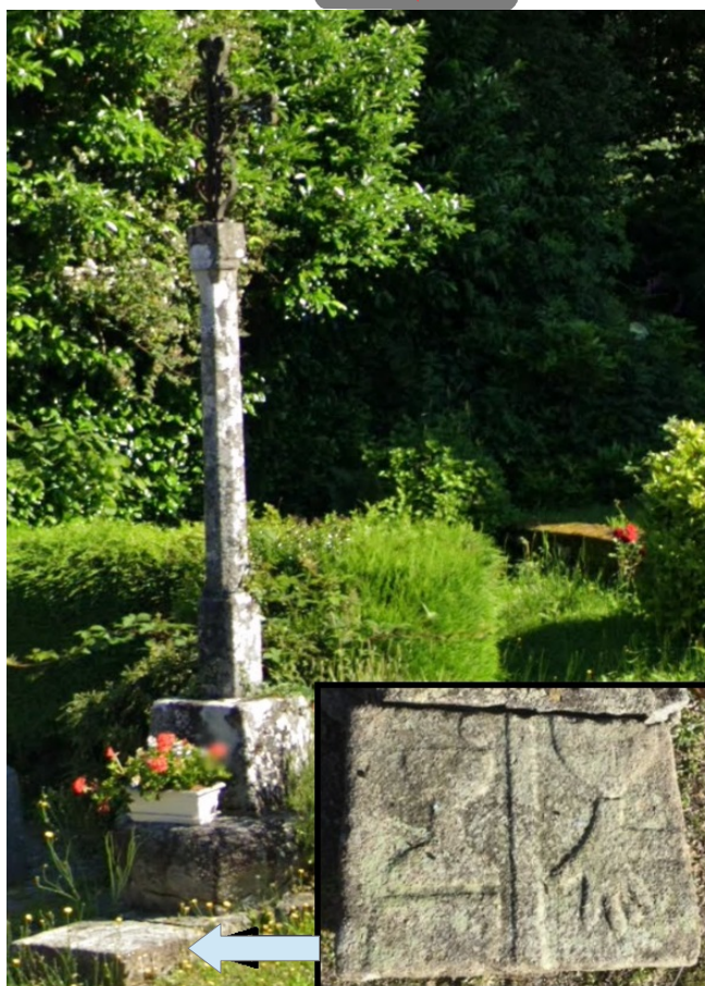
Lépinas - Croix de l'église Cette croix en fer forgé est insérée dans un fût octogonal avec à sa base un dé et au sommet un chapiteau. Le socle est posé sur une énorme pierre de forme arrondie. Au pied de cette croix, un reposoir (ancienne pierre tombale coupée) sur laquelle on aperçoit quatre symboles religieux, un calice, une hostie, un linge liturgique et une main gauche posée à plat. Lépinas fut une paroisse des Hospitaliers de l'ordre de Saint-Jean de Jérusalem dépendante de la commanderie de Maisonnisses et du grand prieuré d'Auvergne. Le commandeur de Maisonnisses y était seigneur et dîmier général avec droit de mainmorte.