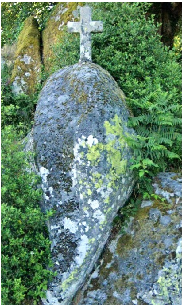
Croix Saint Nicolas à Peyrabout Cette petite croix en granit porte le nom de Saint Nicolas. Elle se trouve perchée sur un énorme amas rocheux à la sortie Ouest du bourg. Elle est située à l'entrée d'un chemin qui était une voie secondaire gallo romaine qui allait rejoindre le hameau de Pétilat où se trouvaient dès 1309, une chapelle et un cimetière dédiés à Saint Nicolas.