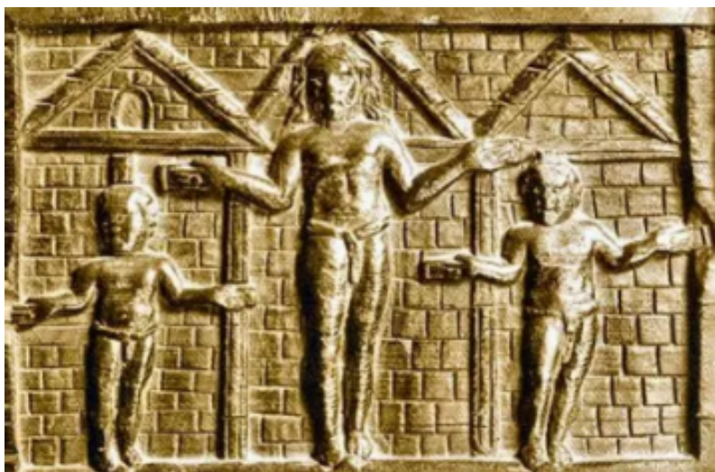
Panneau de la porte de l'église Ste Sabine à Rome

Les premières représentations du Christ Crucifié remontent aux années 430 .