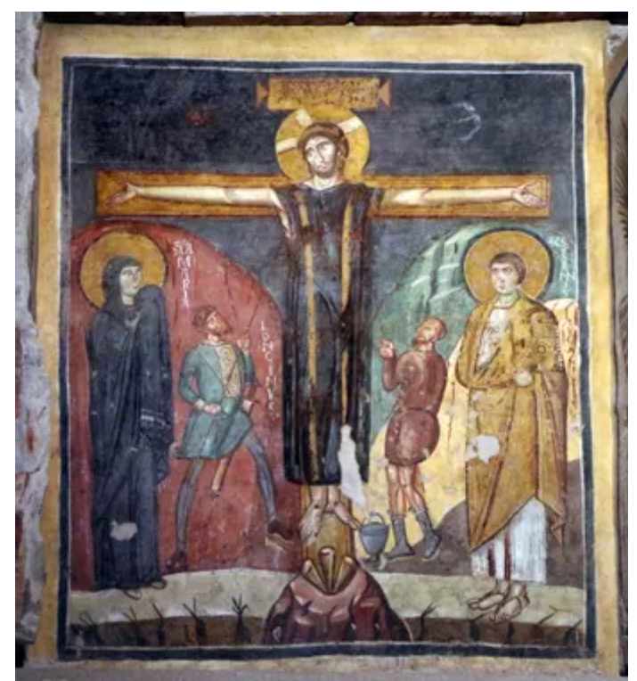
Fresque de l'église Santa Maria Antiqua à Rome